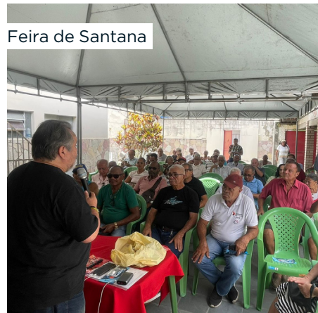
Feira de Santana

No mês de novembro, a Caravana continua nas demais cidades do interior. Confira o Calendário dessas próximas reuniões: